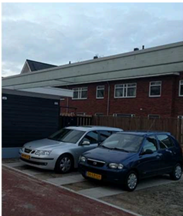
Er moet voldoende parkeer-ruimte zijn voor het gebruik van de plek.