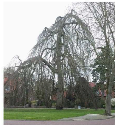
Geef bomen voldoende ruimte om volwassen te kunnen worden.