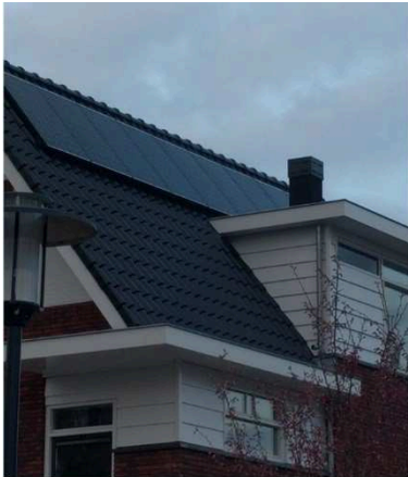
Duurzame energieopwekking zorgt voor een toekomstbestendige woning.