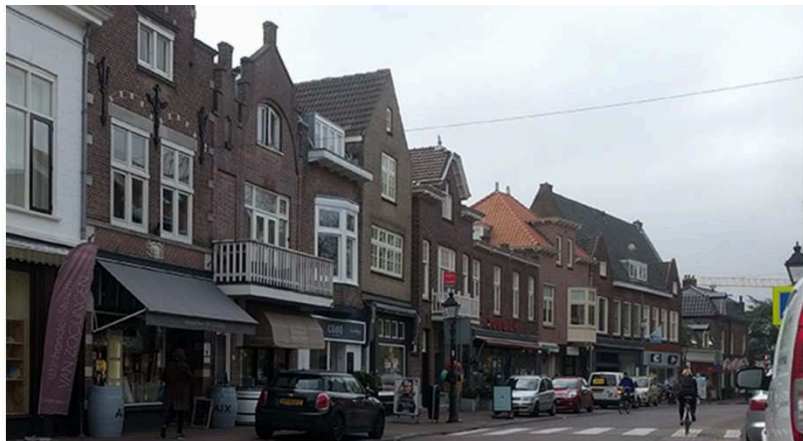
Het combineren van horeca, detailhandel en woningen zorgt voor een levendig centrumgebied. Het bundelen van voorzieningen zorgt tevens voor meer bezoekers en een vitaal centrum.