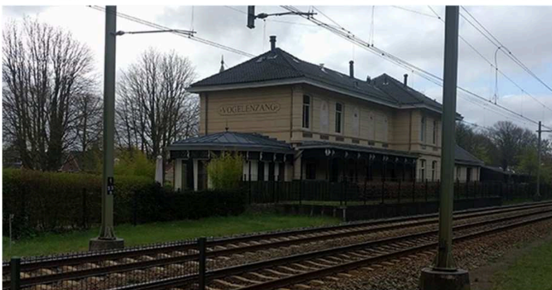
Door kwalitatief te bouwen, hebben gebouwen nog een tweede leven als de oorspronkelijke functie wegvalt. Dit voormalig stationsgebouw is nu, ondermeer, in gebruik als een restaurant.