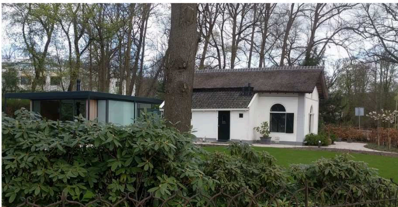
Oude gebouwen kunnen door een aanbouw worden aangepast aan hedendaagse wensen. Door contrast in architectuur blijft het verschil tussen oud en nieuw zichtbaar.