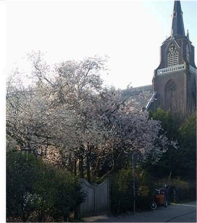
Planten en bomen hebben een sterke impact op de aantrekkelijkheid van een plek.