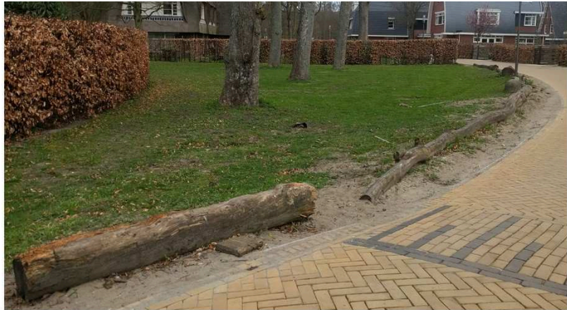
Natuurlijke materialen verouderen op een mooie manier. Beschadigde stalen of betonnen afscheidingen worden veel lager gewaardeerd dan bijvoorbeeld hout.