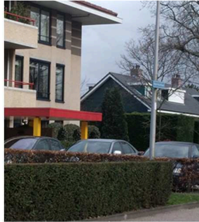
Door het camoufleren van auto's met een haag ontstaat er een fraai natuurlijk beeld.