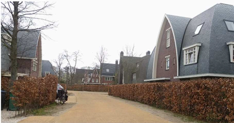
Een goede balans tussen verscheidenheid en uniformiteit zorgt voor een aantrekkelijke omgeving. Dit geldt voor zowel architectuur als in de buitenruimte.