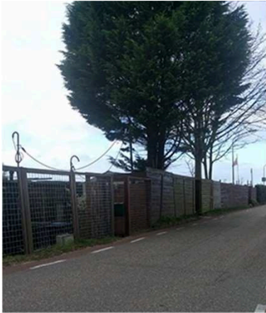
Erfafscheidingen naar de openbare ruimte geven vaak een rommelig beeld.