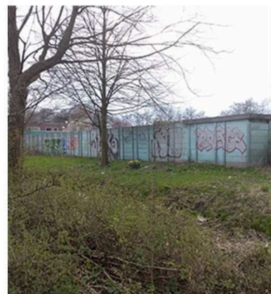
Door het gebruiken van alle ruimte, ontstaan er geen restruimten.