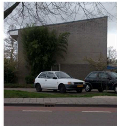
Gesloten gevels of achterkant-situaties dienen te worden vermeden.