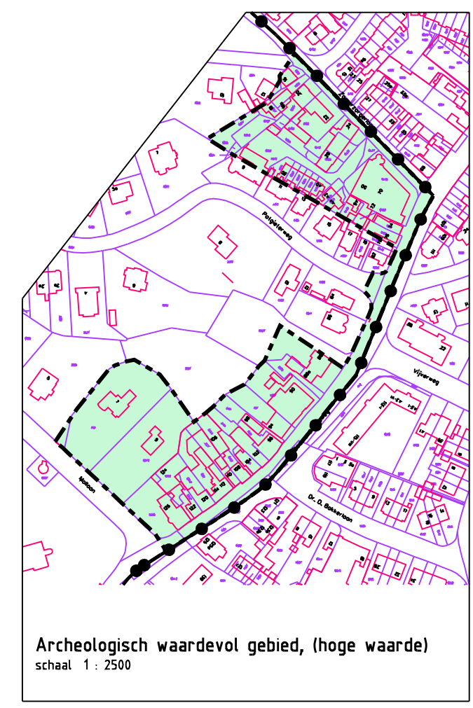
Archeologisch waardevol gebied, (hoge waarde) streekt. 1-2006

Atlas vastgesteld in de openbare vergadering van de raad der gemeente Bloemendaal, gehouden op 18 mei 2006. voorzitter: _____ griffier: _____