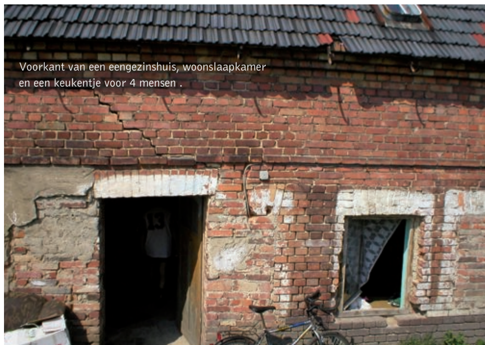
Vorkant van een eengezinshuis, woon slaapkamer en een keukentje voor 4 mensen .

Het alcoholmisbruik van (een van) de ouders is hier een heel groot probleem. Ogeveer een derde van de bevolking van Grabieszyce heeft een drankprobleem. De leerkrachten proberen de kinderen weer te interesseren voor school. Daarom gaan ze op huisbezoek bij de schoolkinderen en hun ouders om te praten over het verzuim. Ook zorgen ze voor bijles en extra les thuis. De zorg van de docenten strekt zich zelfs uit tot het regelen van het ontbijt en lunch op school en inzamelen van kleding voor deze kinderen. Ook de 'naschoolse opvang' komt geheel terecht op de leerkrachten. Ze bedenken van alles om de kinderen op een leuke manier bezig te houden: er zijn bijvoorbeeld handwerkclubjes en een voetbalclub, waar iedereen mag meetrainen met het schoolteam. PPL helpt de school aan kleding, maar ook aan leermiddelen, hulp aan gezinnen en computers. Heel recent leverden we een orgel, aangeboden door iemand in Bloemendaal, af op de school.