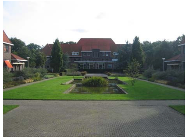
Zicht op de achtergevel van het hoofdgebouw gezien vanuit het 'Paviljoensplein' en de kerk