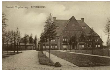
Hoofdgebouw rond 1927