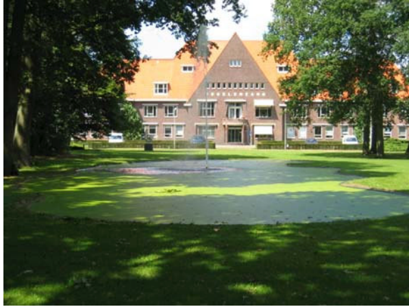
Voorgevel met gazon, waterpartij en fontein